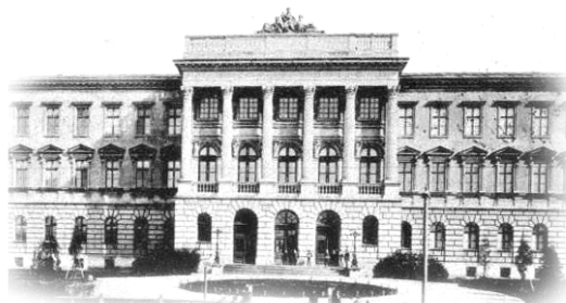
Головний корпус Львівської політехніки

Національний університет "Львівська політехніка" Колегія та профком студентів і аспірантів Рада молодих вчених